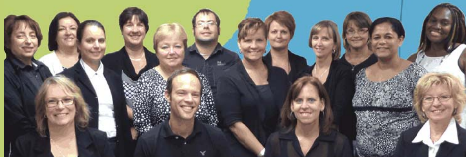
Suzie Bus Frédéric M Ruth Giro Louise Ass